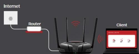
Access Point Mode

Creates a wireless network for all your WiFi devices