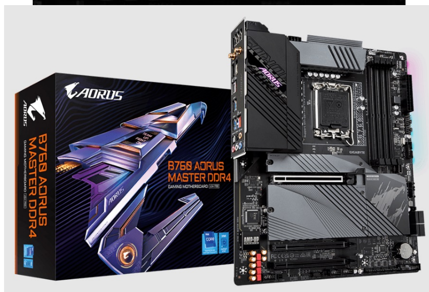
GIGABYTE B760 AORUS MASTER DDR4