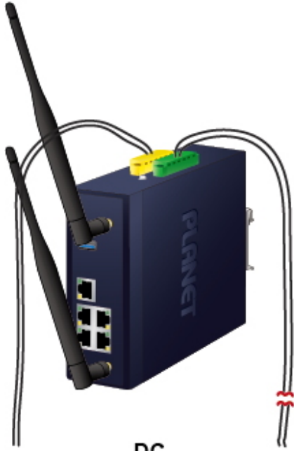
DC Power Failure