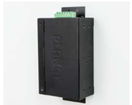
Side Wall Mounting (Space saving)